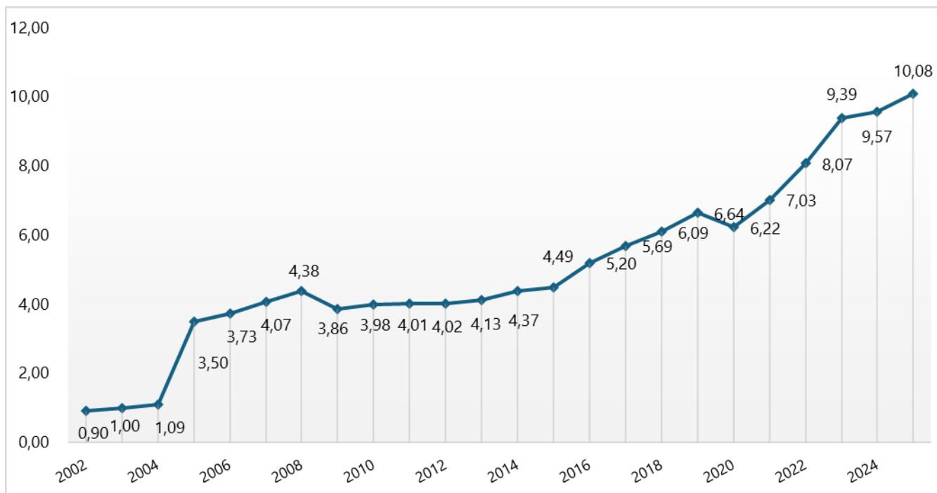
Graf č. 3: Srovnání celkových příjmů ze sdílených daní v letech 2002 až 2025 (v mld. Kč)

Běžné výdaje (po konsolidaci) v objemu 22 834 229,46 tis. Kč byly k 31. 12. 2025 čerpány na 97,52 % platného rozpočtu. Nejvýznamnějšími výdajovými položkami byly zejména: